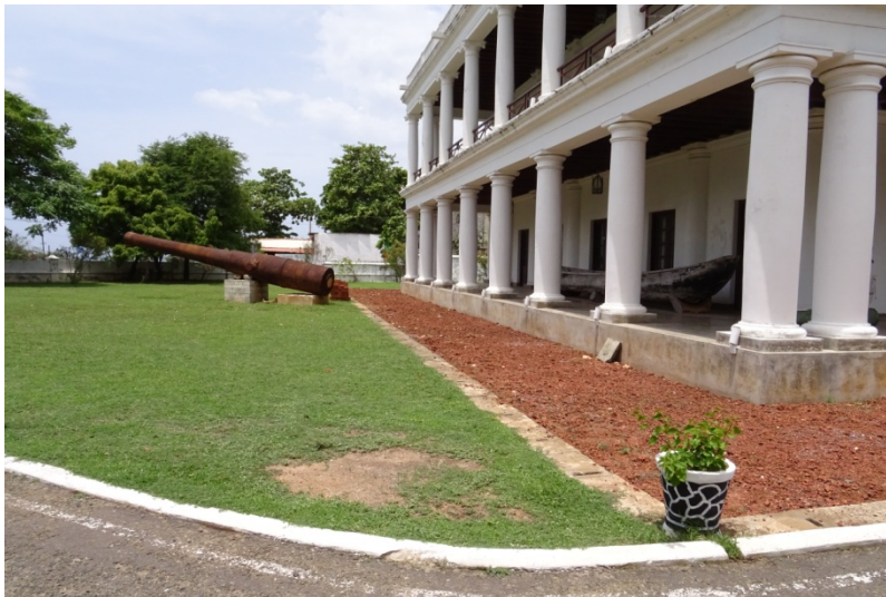
(海事博物館の中庭)

トリンコマリーは古くから自然の二重の湾に面した良港であったので、大航海時代から、重要な港町として栄え、また各時代の海防拠点として、重要な位置を占めてきました。